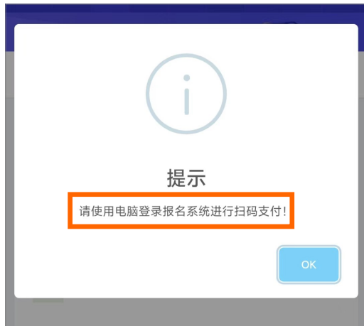
手机端不支持缴费